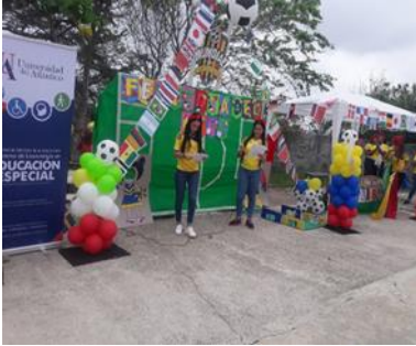
DIA DEL NIÑO “MUNDIAL INCLUSIVO”, Tubará - Atlántico, abril 28 de 2018